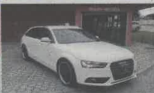
AUDI A4 2.0TDI SPORT AVANT ANO 2012 | 79 991KMS | NACIONAL