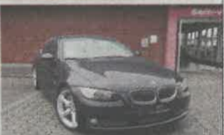
BMW 335i COUPÉ ANO 2007 | 187 316KMS | NACIONAL