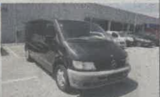
MERCEDES VITO L 112CDI ANO 2003 | 19 LUGARES