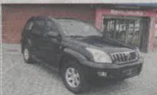
TOYOTA LANDCRUISER 3.0D-4D ANO 2003 | NACIONAL | 18 LUGARES