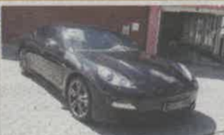
PORSCHE PANAMERA DIESEL ANO 2012 | NACIONAL