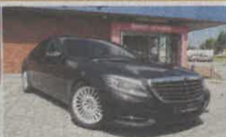
MERCEDES S300 HYBRID ANO 2015 | 146 690KMS | NACIONAL