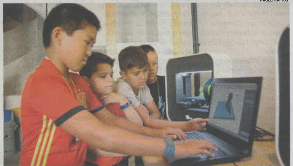
Alunos estão dedicados a várias actividades durante os cinco dias