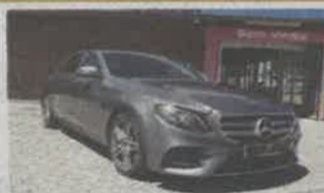
MERCEDES E220 D ANO 2017 | 136 250KMS | NACIONAL

RUA DE SÃO JOÃO, Nº49, VERDEMILHO 3810-455 AVEIRO