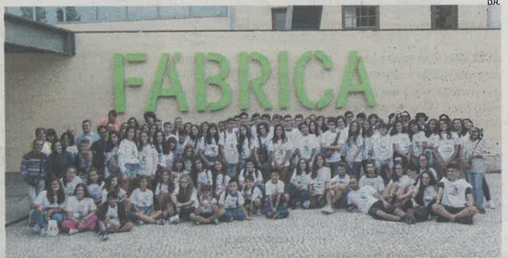
Mais de uma centena de participantes juntaram-se na Fábrica Centro Ciência Viva

(Escola Secundária Dr. João Carlos Celestino Gomes, de Ílhavo; Escola Secundária Dr. Mário Sacramento, de Aveiro; e Colégio Nossa Senhora da Apresentação, de Vagos) e a uma escola da região de Lisboa.