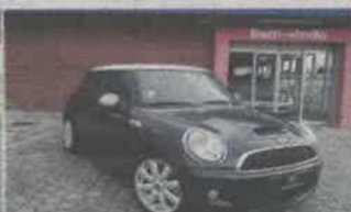
MINI COOPERS ANO 2007 | 138 825KMS | NACIONAL