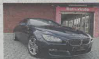
BMW 640D GRAN COUPÉ ANO 2012 | 100 778KMS | NACIONAL