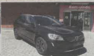
VOLVO XC60 D3 ANO 2017 | 30 781KMS | NACIONAL