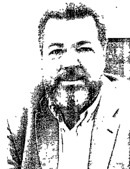
López de Uralde ofreció ayer una charla en Ourense. PILIPROU

El responsable de la gestión diaria de Greenpeace pide mano dura para evitar la destrucción del litoral y dice que la ley de los 500 metros tenía una vía de escape